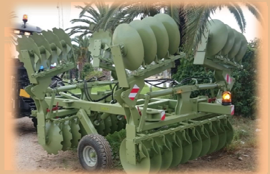
CCL 18/36 LR (Lourd Repliable)