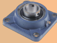
TYPE DE PALIER : UCF