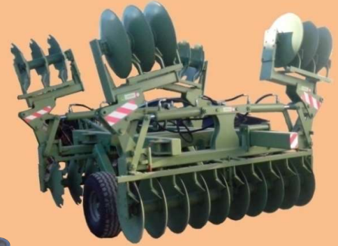
CCL 16/32 LR (Lourd Repliable)